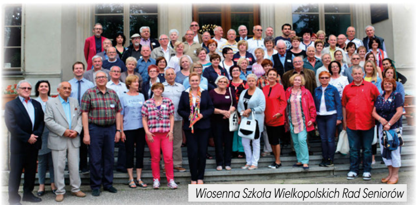
Wiosenna Szkoła Wielkopolskich Rad Seniorów